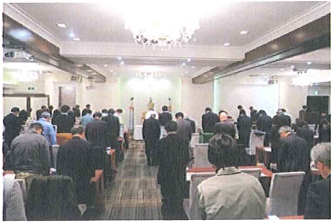
安全祈願を行う会員企業の皆さん