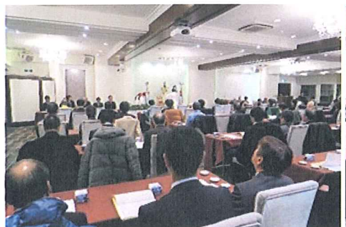
安全祈願祭会場風景