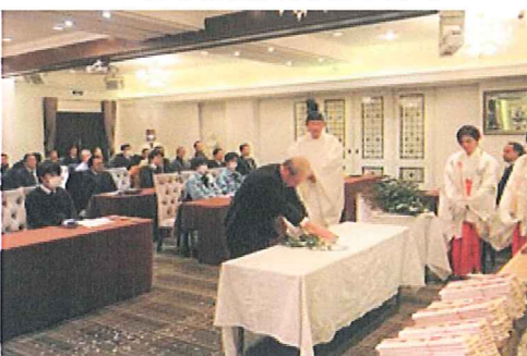
安全祈願を行う役員