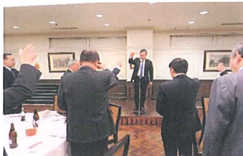
乾杯の音頭をとる 内堀副会長