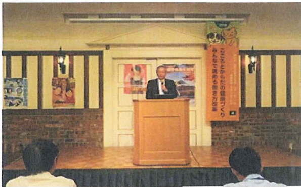
光山監督署長挨拶